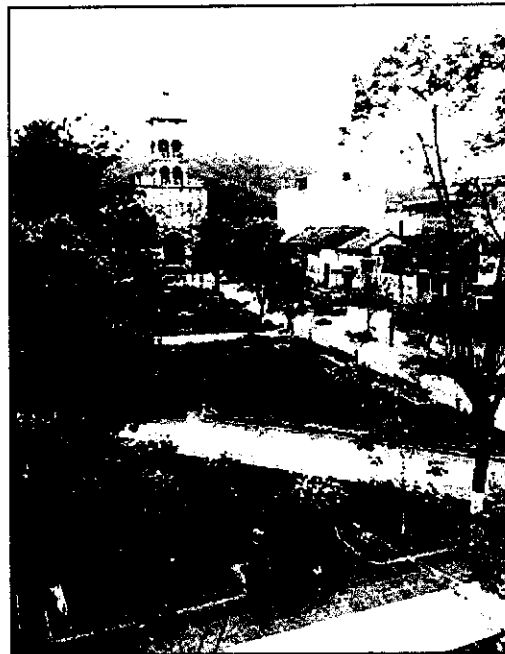
Plaza de Entre Ríos.